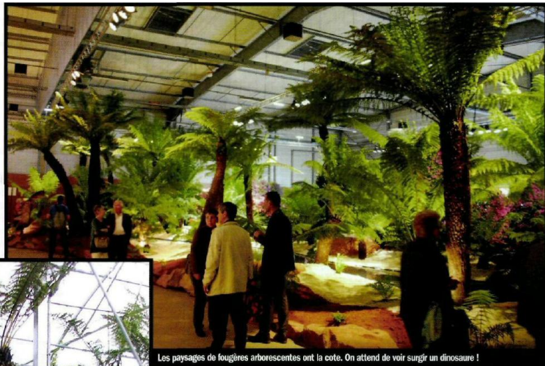
Les paysages de fougères arborescentes ont la cote. On attend de voir surgir un dinosaure !